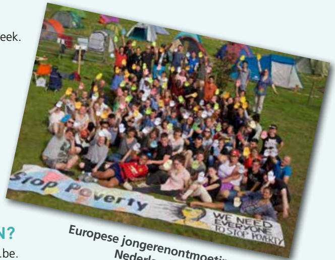
Europese jongerenontmoeting in Wijhe Nederland - augustus 2017 ▲

Actuele informatie: zie www.atd-vierdewereld.be