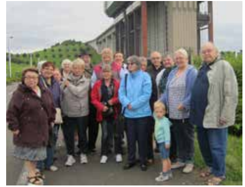
Familie-uitstap met de groep van Sambreville ▲