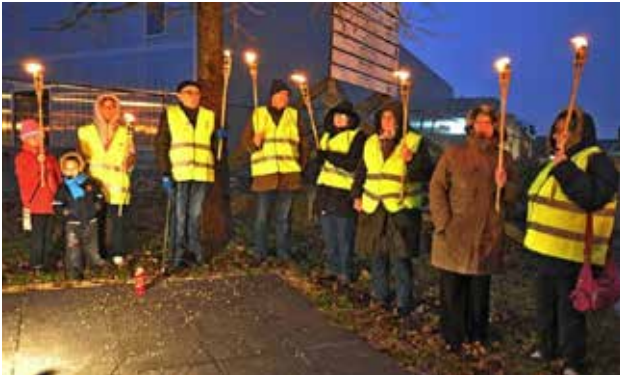
Bijeenkomst aan de Gedenksteen op de Werelddag van Verzet tegen Extreme Armoede ▲

Deze principes van trouw en steun zijn het fundament van de groep, maar er zijn ook concrete doelstellingen.