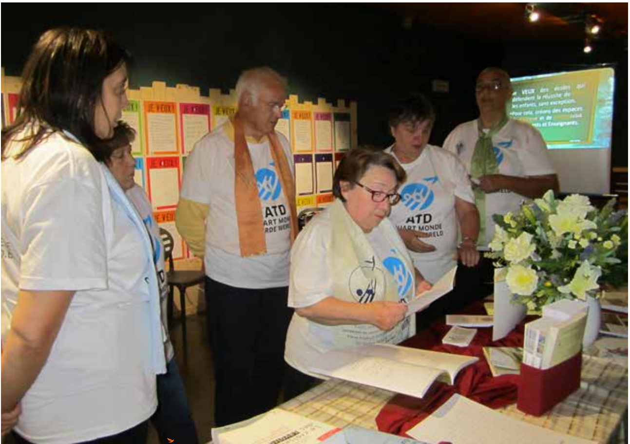
De groep van La Louvière ▲